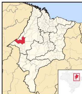
Açailândia, nella regione del Carajás, Brasile.